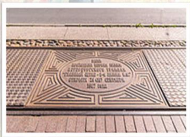
Мемориальная плита на месте первого трамвайного маршрута