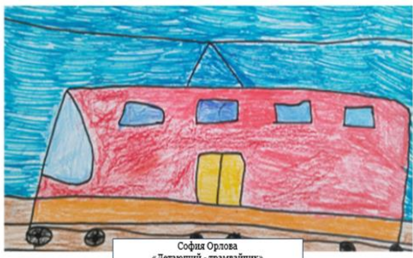
София Орлова «Летающий - трамвайчик» (он летает на воздушных рельсах)